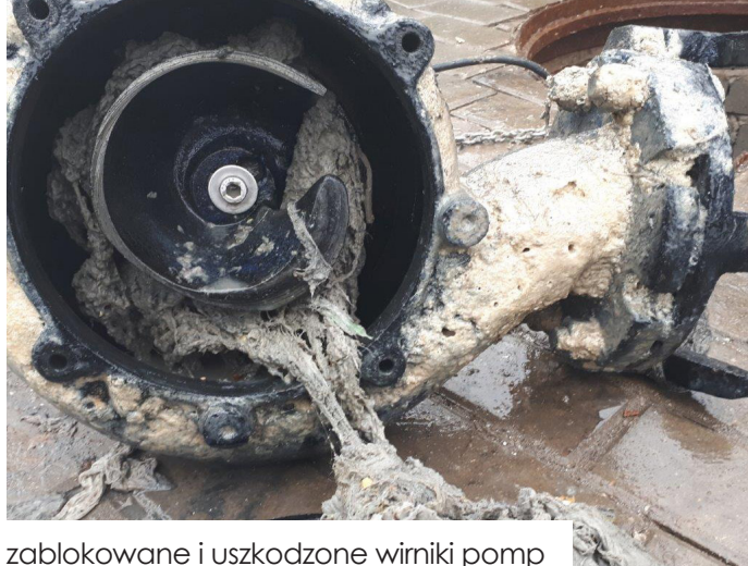
zablokowane i uszkodzone wirniki pomp