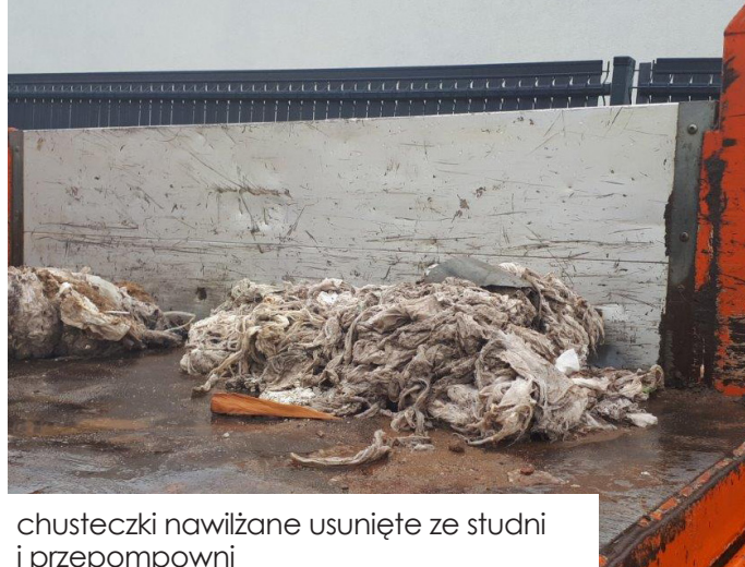
chusteczki nawilżane usunięte ze studni i przepompowni